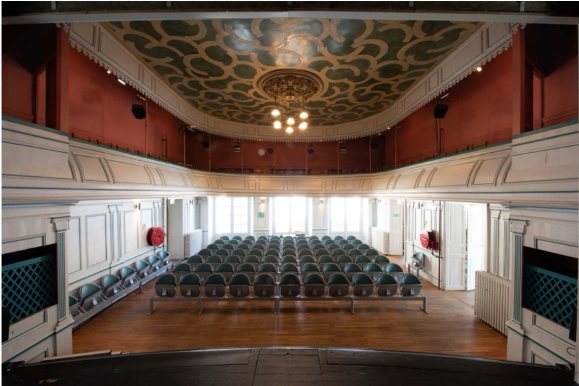
La salle de spectacle