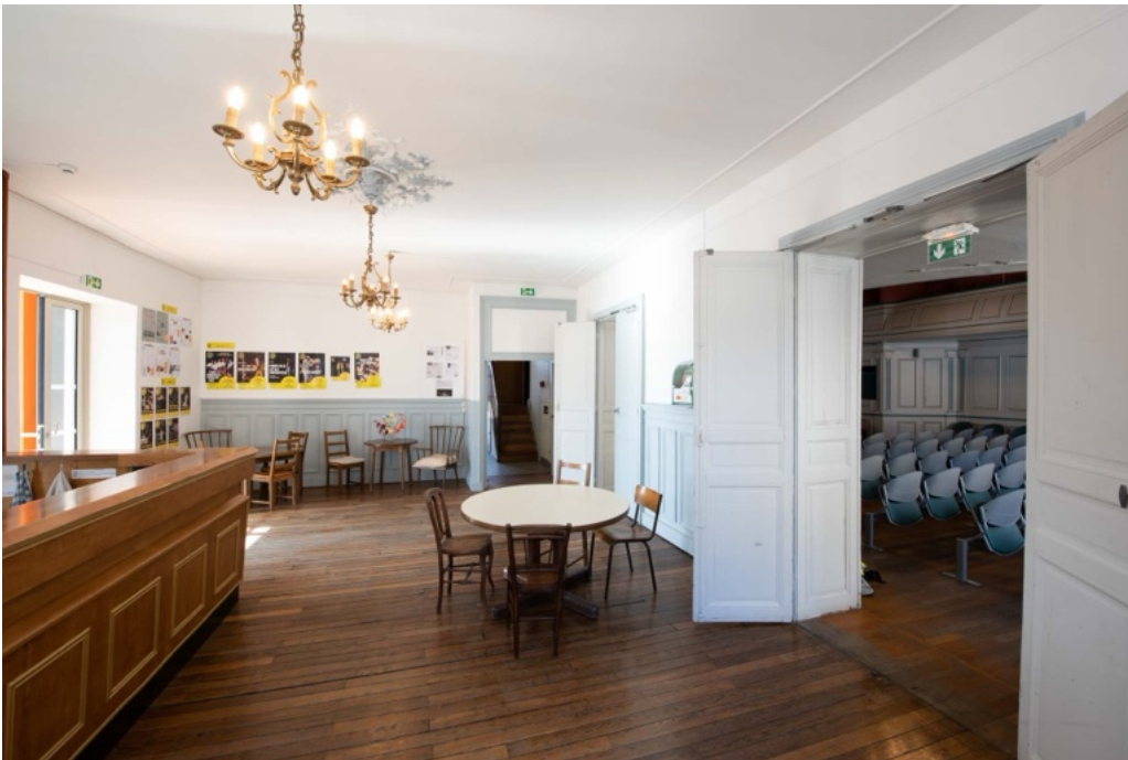
Le foyer bar, espace partagé Un réfrigérateur, 2 micro-ondes, un cuiseur à riz, une bouilloire, un percolateur, etc.